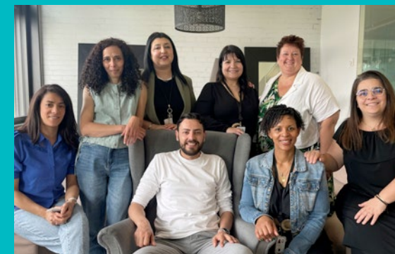
L'agence relation partenaires concrétise les demandes de crédit des clients de nos partenaires (ici, une partie de l'équipe de Roubaix)

€370 millions de prêts travaux accordés en 2023