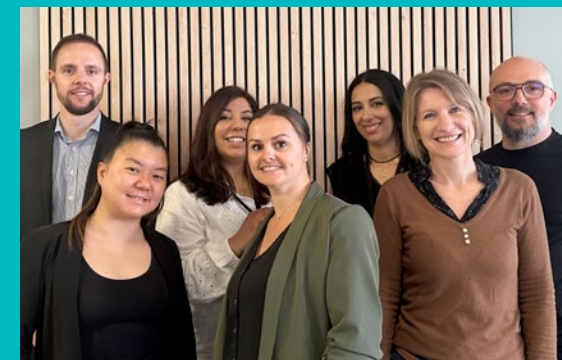
L'agence d'accompagnement client prend en charge les clients les plus fragiles (ici, une partie de l'équipe)

En complément, les personnes sourdes et malentendantes peuvent entrer en relation avec les conseillers téléphoniques de Sofinco : la conversation est retranscrite en direct dans la langue des signes par un traducteur de la société Acceo (service gratuit).