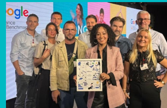
L'innovation fait partie de l'ADN de Sofinco (ici une partie de l'équipe Digital et Innovation)

Nous travaillons avec de jeunes entreprises innovantes pour nous améliorer, comme AlloBrain. Sa solution de message vocal vous propose de laisser votre avis sur Sofinco, oralement : plus besoin d'écrire. Votre commentaire, analysé par une intelligence artificielle, nous permet de nous améliorer rapidement.