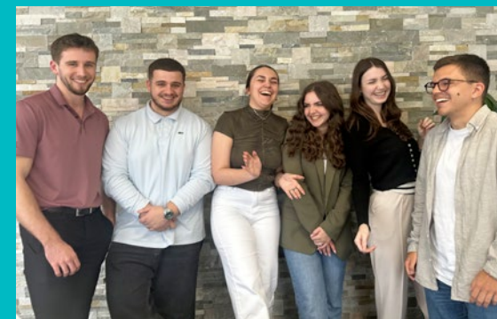
Certains alternants de Sofinco (ici sur notre site de Roubaix)

Pour permettre à ses collaborateurs de s'occuper d'un proche en perte d'autonomie ou en situation de handicap, Sofinco a mis en place un temps partiel aidé, un fonds de solidarité dans lequel les collègues qui le souhaitent donnent des jours de congés, des campagnes de dons de jours et l'appui d'un prestataire spécialisé .